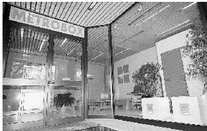
Vista dall'esterno, la reception è uguale a quella di un normale albergo

marito buttato fuori di casa, in cerca di un posto in cui tenere provvisoriamente la roba che la moglie gli ha fatto trovare sul pianerottolo. In certi casi siamo costretti ad assistere a veri e propri litigi in diretta, perché in genere le coppie che si separano preferiscono rivolgersi a un'unica ditta di traslochi e se non hanno ancora trovato un posto per le rispettive cose vengono da noi e attaccano ad accapigliarsi per il tavolino o per la lampada: quello era di mia madre, quella l'avevo comprata io, e via di questo passo».