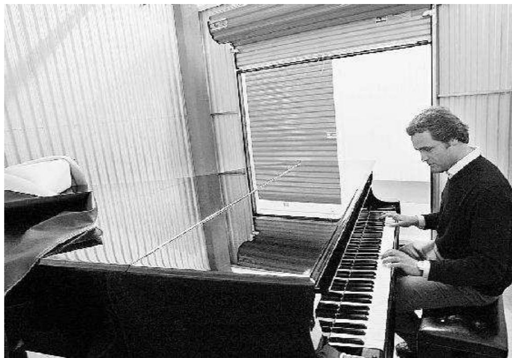
Il pianoforte sfrattato C'è di tutto dietro le saracinesche dei self storage italiani. Anche strumenti musicali, come questo pianoforte cacciato dalla casa del suo proprietario causa continue liti con i condomini. Così, a chi entra e esce dai box capita di tanto in tanto di ascoltare un concerto.

Sono i clienti tipo: in attesa di una nuova sistemazione portano qui mobili e fotografie